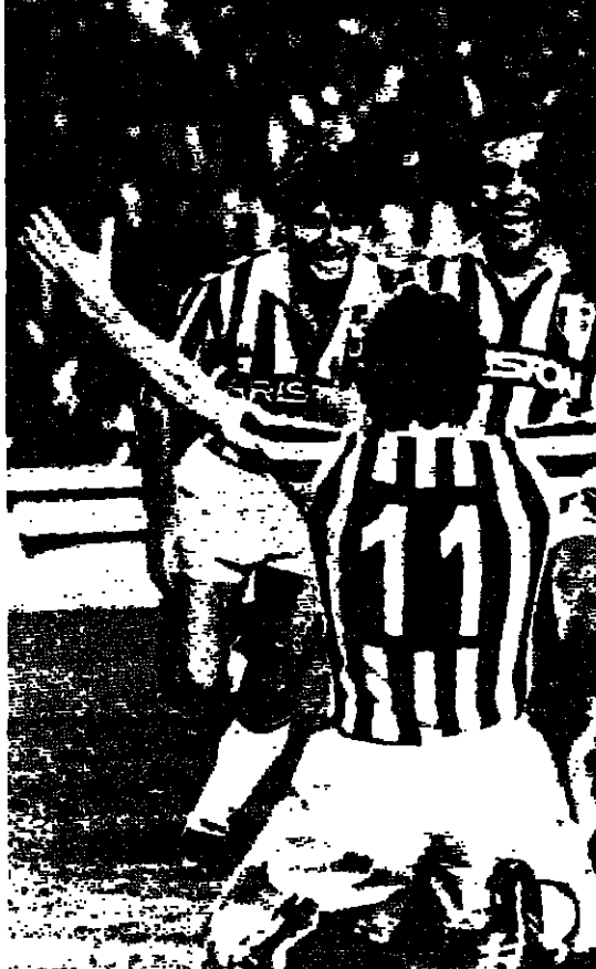
اللاعب الفرنسي ميشال بلاتيني يسارع لتهيئة بونيت بعد تسجيل هدف جونفوتوس الثالث في مرمى بورود بصفيات الكؤوس الأوروبية (أ.ف.ب - راديو)

يبدا ان فريق يوردي الفرنسي ويلين ميونخ الالمانى الغربي سوف يتطلع لبعض الحسد الى ما سيجده نظيره في الدوري الالمانى والاسياني املا بان يشارا لهزيمة الاربعة في تصفيات الكؤوس الأوروبية لكرة القدم والتي كان قد اضرها اسن ان يثاقها.